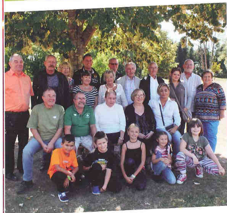
GRUPE DE L'ANNÉE DERNIÈRE

Les groupes de plus de 25 personnes ont été récompensés par une coupe et les enfants par un diplôme.